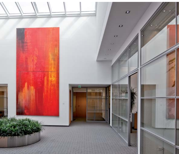
Red Rain, 2008, 500 x 250 cm, Öl, Pigment auf Leinwand, Eingangshalle Stadtparkasse Wuppertal, Zweigstelle Loh