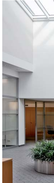
Soft Landing, 2009, Öl/Lw., 120 x 150 cm