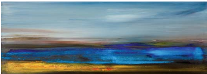
Movements, 2009, Öl/Lw., 50x150 cm

Die Arbeiten von Christian von Grumbkow bestechen durch feinsinnig komponierte Farbschichten, die sich teils transparent überlagern, an anderer Stelle in pastosem Relief aufeinander liegen. An einigen Stellen entstehen Farbverläufe, wo die Töne miteinander verschwimmen, an anderen effektvolle Kontraste von gegeneinander gesetzten Flächen. Als strukturierendes Element ziehen sich immer wieder waagerechte und senkrechte Linien durch die Bilder. Es sind jedoch nicht