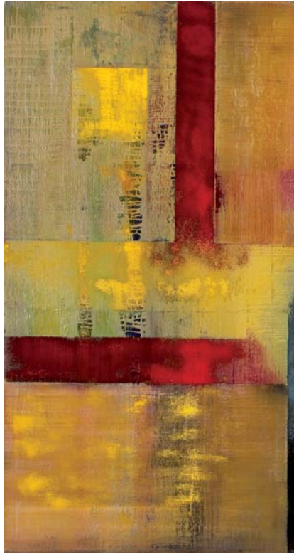
Ostern, 2009, Öl auf Leinwand, Diptychon, 160 x 240 cm