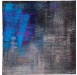
Ohne Titel, '09, Öl/Lw., 80x80 cm