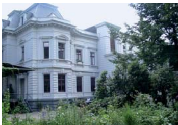
Friedrich-Ebert-Straße 152, Gartenseite

Mit den Augen Epikurs wollen wir dabei die Kunst betrachtet wissen – als einen lebendigen Bestandteil unseres Daseins, als wichtigen Beitrag zur Schärfung unserer Wahrnehmung und unserer Sichtweisen. Dies zu erreichen gelingt unserer Ansicht nach am besten in der Kommunikation, im gegenseitigen Austausch. Denn was wäre Kunst, wenn sie nicht für uns Bedeutung erlangen