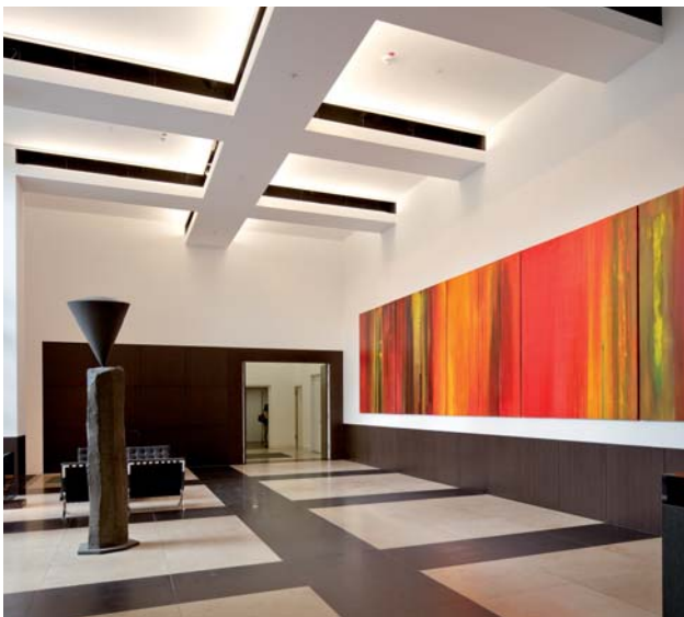
Appassionata, 2009, Ölfarbe, Eitempera auf Leinwand, 5-teilig, 2,50 x 12,50 m, Foyer der Barmenia Versicherung, Wuppertal